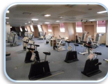
フィットネスジム

温水プールは、 長さ25m、水深120cmのコースが4コース ( 遊泳コース2・自由コース2 )、 水深60cmの子ども用コース 、 ジャグジー を完備しています。