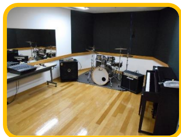
音楽スタジオ1 音楽スタジオ2