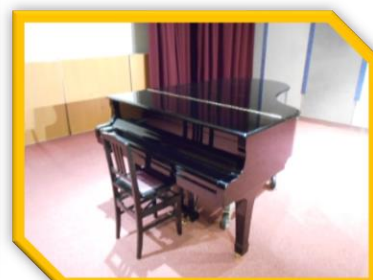
iスペース グランドピアノ